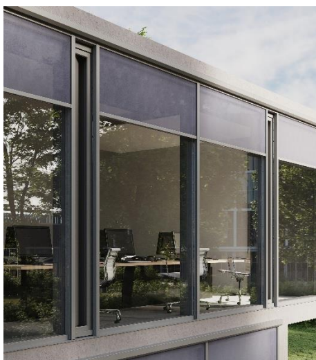
[heroal VS Z CS Ambiente]

Dzięki możliwości integracji silników solarnych systemy rolet heroal mogą być napędzane bez osobnego doprowadzania energii elektrycznej, a tym samym w sposób wyjątkowo wydajny energetycznie.